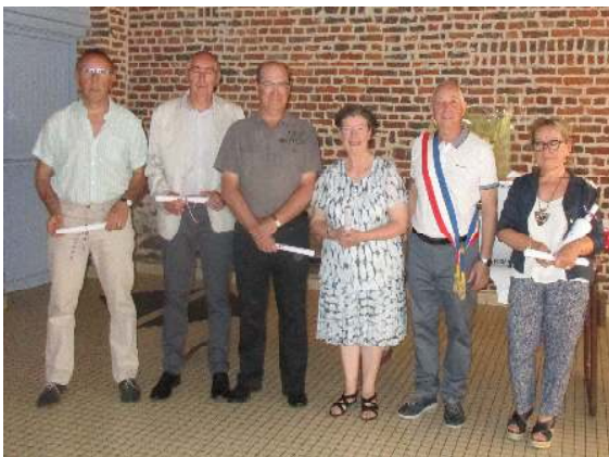
8 mai - Félicitations à nos médaillés