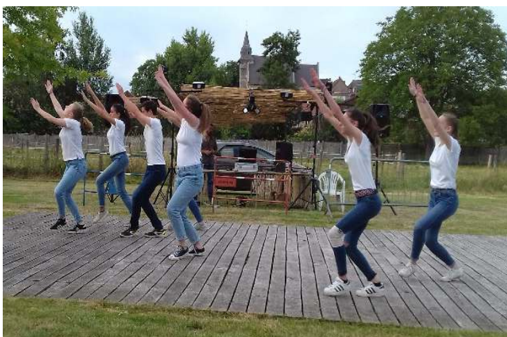
Un groupe des dynamites