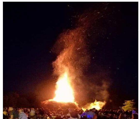
Feux de Saint-Jean, le samedi 23 juin