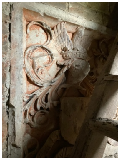
Derrière l'escalier du clocher les armoiries avec le blason portant 3 coqs