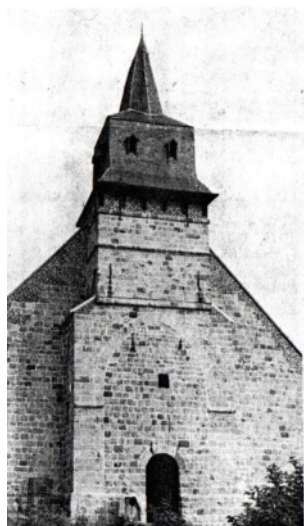
Tour-clocher à demi encastrée dans le mur pignon ouest avec le grand arc ogival dessiné dans le mur.

Nous pouvons voir sur la photo un coq les ailes déployées qui d'après la science des armoiries, l'Héraldique, est le cimier. Ce coq symboliserait : « la garde et la vigilance » Celui-ci est posé sur le Timbre, genre de couronne servant à désigner la qualité ou la fonction de la personne; lui-même posé sur le casque Heaume de l'armure, ensuite nous trouvons au centre, l'écu qui est le support physique du blason représentant les trois coqs, en bas la devise, et le tout enrichi de lambrequins partant du casque.