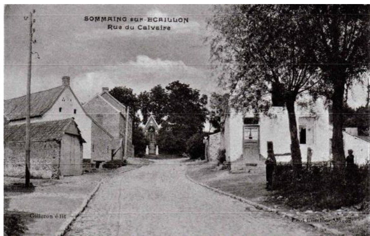
Le calvaire dans les années 1920