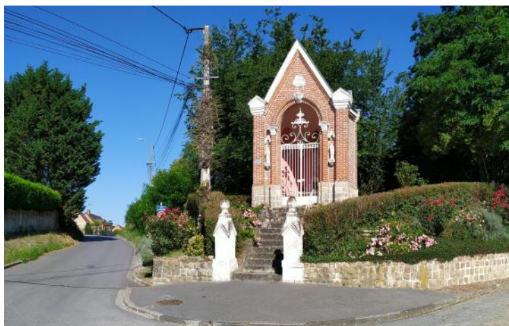
Le calvaire de nos jours